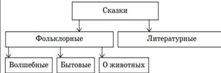
иллюстрация как представленной в схематическом виде, обобщение отражение сюжета представлений о видах сказок, выполнение задания волшебной сказки «Вспомните и назовите произведения». (например, картины В.М. Васнецова, иллюстрации И.Я. Билибина).

Учебный диалог: осознание нравственно-этических норм: смелость, храбрость, доброта, трудолюбие, честность в народных и литературных (авторских) произведениях, нахождение особенностей сказок, определение их вида (бытовая, о животных, волшебная).